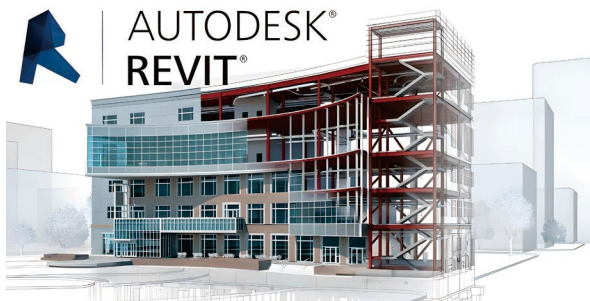
Autodesk사 BIM(Revit) 소프트웨어 활용