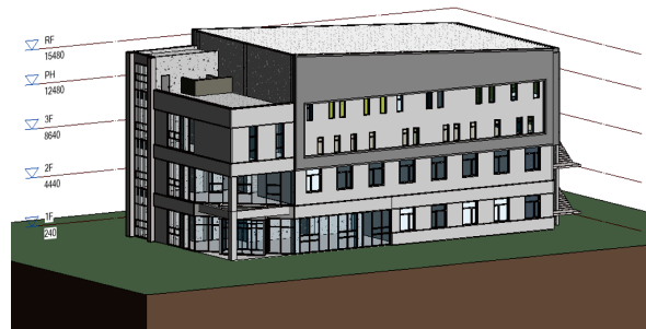
Autodesk사 BIM 소프트웨어 활용 수료생 건축전기설계 결과물