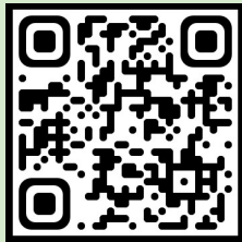
25년도 1기 수료식 (YouTube)