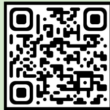
25년도 1기 수료식